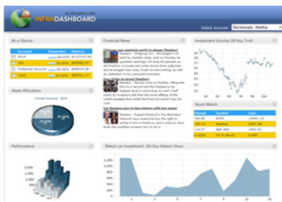
WebGrid™ と JSF WebChart™ を 使用した JSF InfraDashboard™

ユーザーは WebGrid 内の特定のセルにフォーカスをセットしたり、キーボード操作によりアクティブ セルを移動させたりできます。